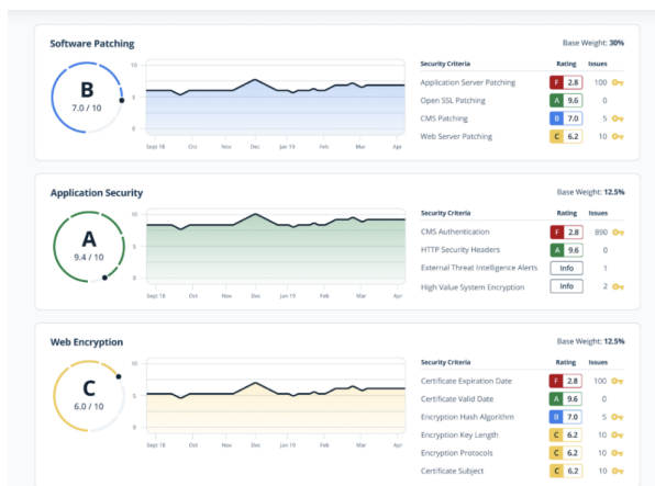
カテゴリ別のリスク詳細